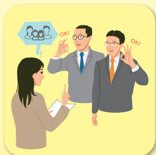
⑤ ボランティアの依頼