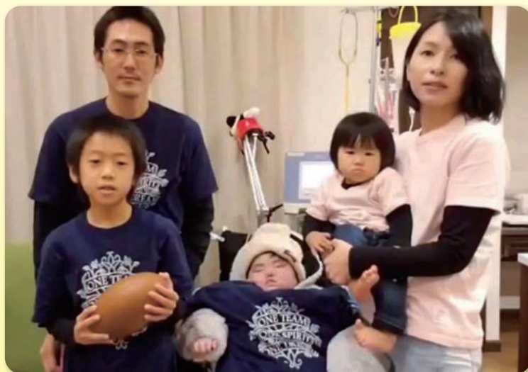
病児家族からラグビー選手へのエール返し