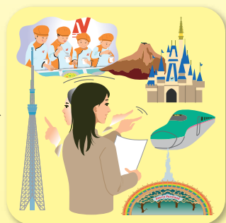
⑥ テーマパーク等下見