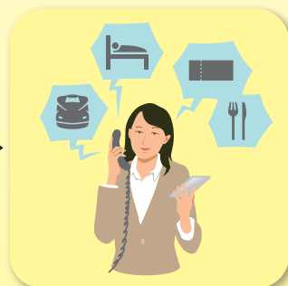
⑦ 各種チケットの手配