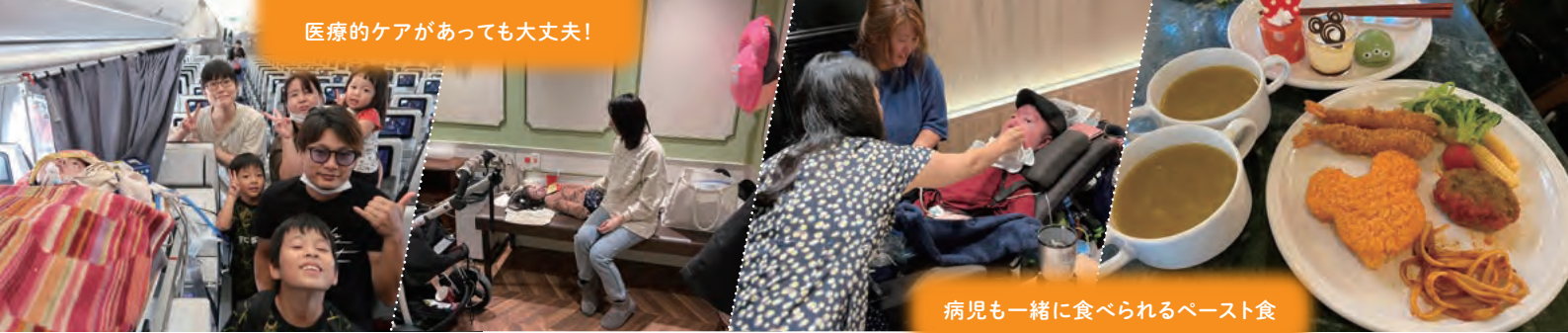
病児と一緒に食べられるペースト食